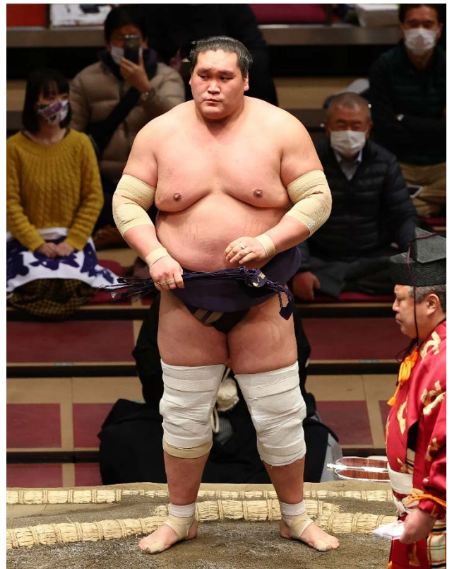
「照ノ富士」