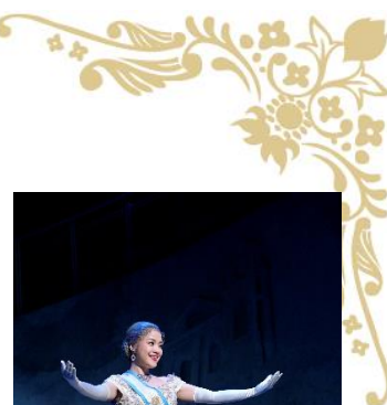
『エビータ』