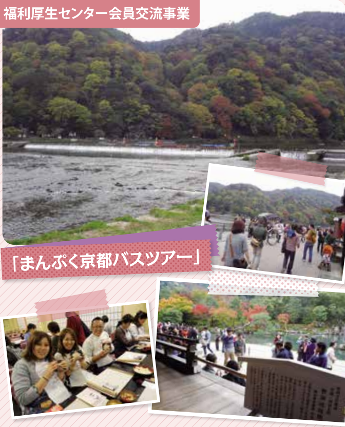
「まんぷく京都バスツアー」