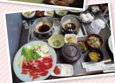
「長野善光寺参拝と金具屋に泊まる渋温泉」